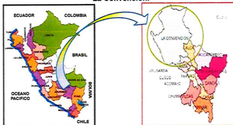
Imagen N° 2: Provincia y Distrito