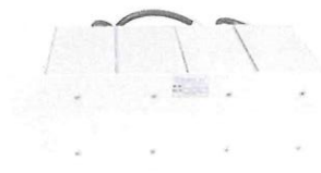
IMAGEN REFERENCIAL E/T N°298