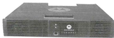
IMAGEN REFERENCIAL E/T N°297