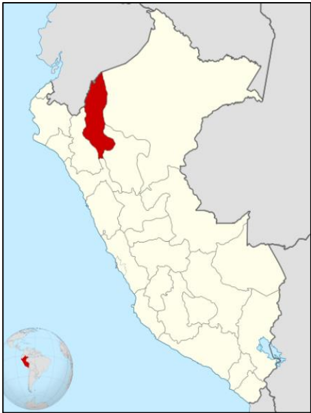
MACRO LOCALIZACIÓN DEL PROYECTO Figura N° 01: MAPA DE UBICACIÓN DEL PROYECTO

A continuación, en la Imagen N° 1, se muestra el esquema de macro localización del Centro Poblado de Tomaque.