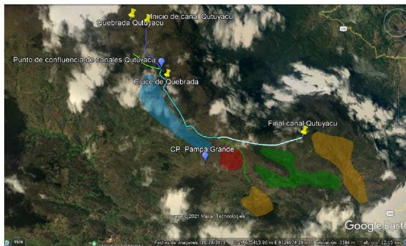
Vistas fotográficas del canal Qutu Yaku.