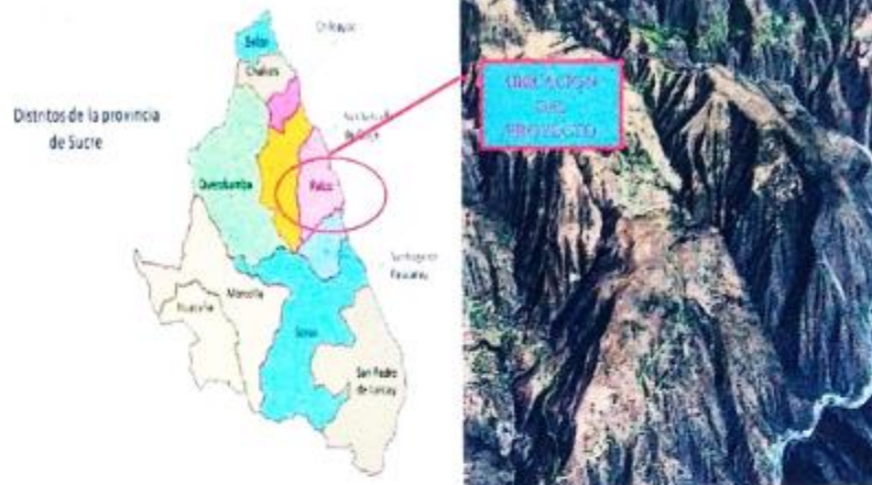
Figura: Localización Tramo