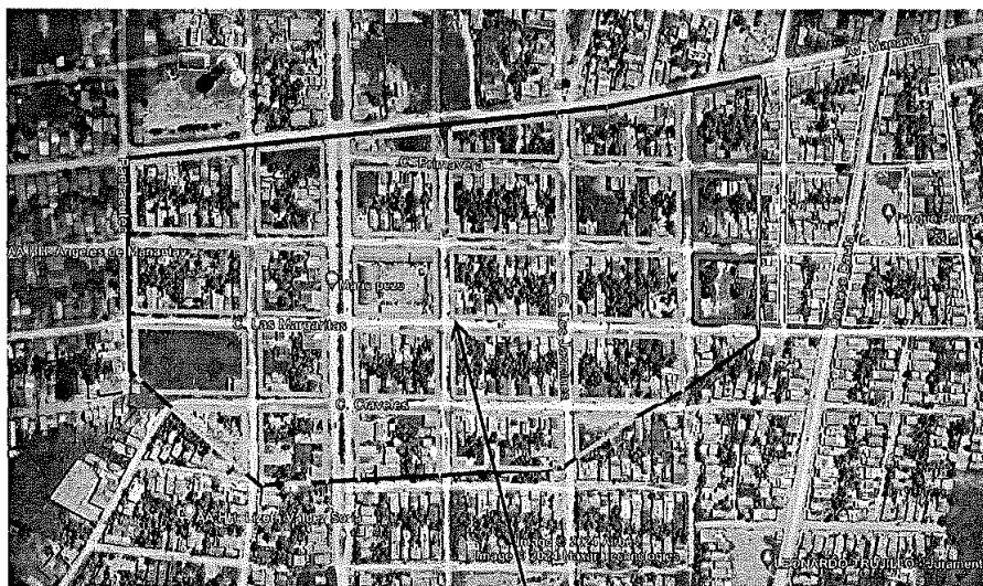
ÁREA DE INTERVENCIÓN