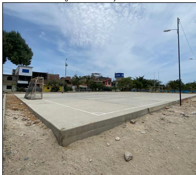
Imagen N°01: Demarcación desgatada de Losa y Arcos oxidados con malla deteriorada.

Después de realizar la visita de inspección correspondiente, se pudo constatar que las condiciones de la losa y las gradas de la tribuna están deterioradas. Es evidente que la infraestructura de las gradas está en estado de colapso, no cuenta con cubierta, lo cual genera malestar a los usuarios ya que la losa y las gradas están expuestas a la intemperie. Además, presenta grietas y desprendimiento de pintura, finalmente se pudo observar en el terreno un desnivel y un sardinel inconcluso.