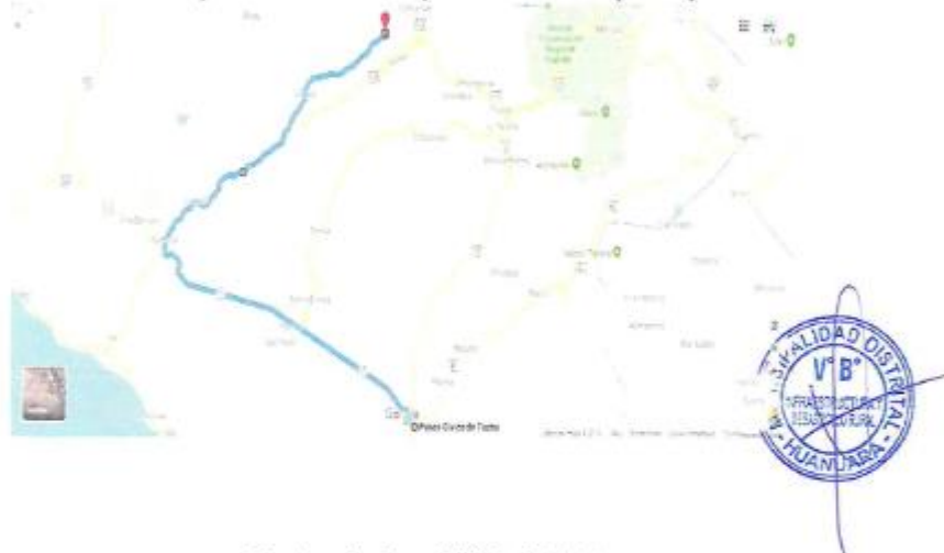
Cuadro de Accesibilidad N° 01

El Área de estudio se encuentra ubicada en el Distrito de Huanuara, Provincia de Candarave y se llega a él mediante una carretera asfaltada la vía panamericana parte de la ciudad de Tacna hasta el cruce de la carretera Ilabaya Cambaya Camilaca (121.00 Km), de ahí una carretera a nivel de trocha afirmada desde el cruce del río Ilabaya hasta el Distrito capital de Huanuara (24 Km).