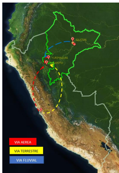
FIGURA.3 Mapa de vías de acceso a la ciudad de Yurimaguas

Tenemos que indicar durante el proceso de actualización de los estudios topográficos, se tuvo que abrir una trocha a sable en el último tramo de 2.00 km de selva virgen. El acceso es multimodal, empleando diversos medios de comunicación; terrestre, fluvial y aéreo, desde las ciudades de Lima, Tarapoto, Iquitos, y otros. Si tomamos los puntos de partida, para llegar a Yurimaguas, la ciudad de Lima y la ciudad de Iquitos.