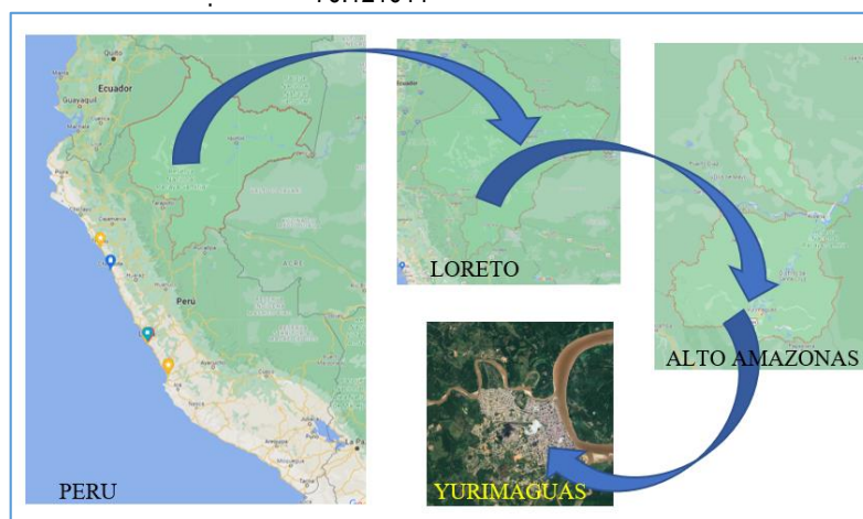
FIGURA.1 Ubicación Geográfica del Proyecto.