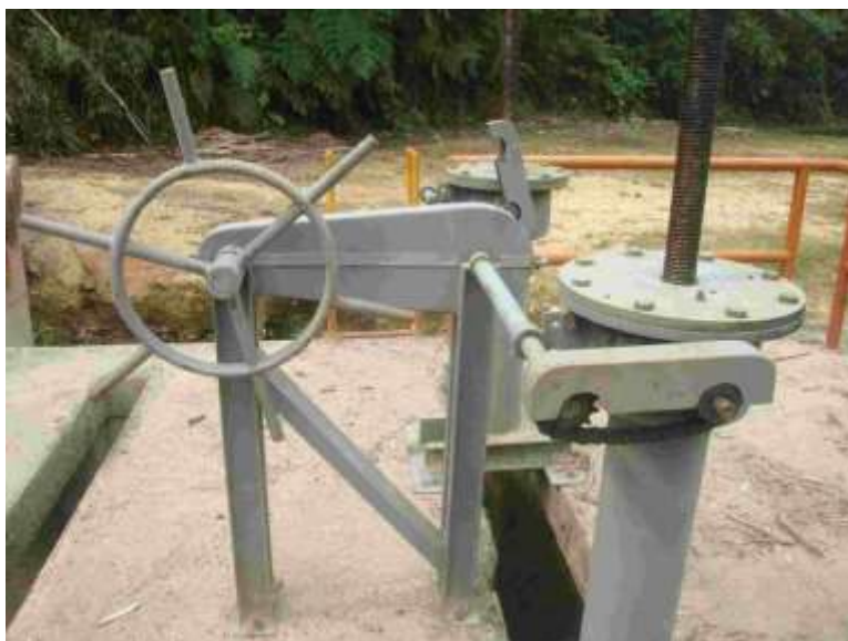
FOTOGRAFÍA 3. Mecanismo de izaje y tornillo con mando manual