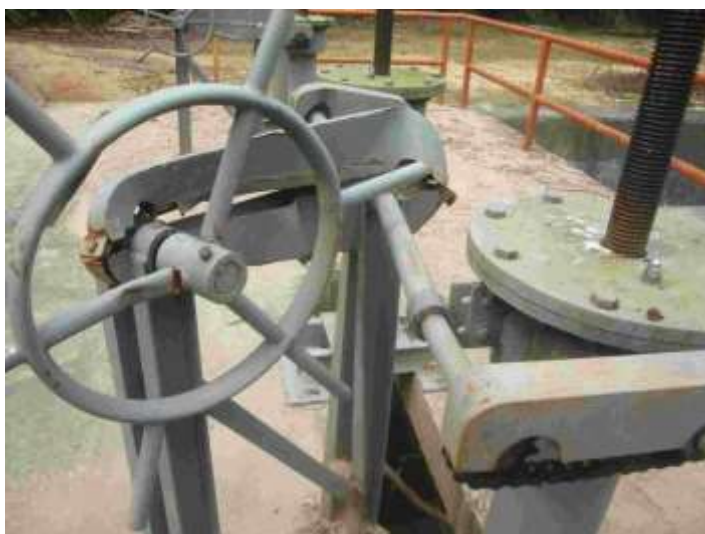
FOTOGRAFÍA 4. Mecanismo de izaje y tornillo Averiado.