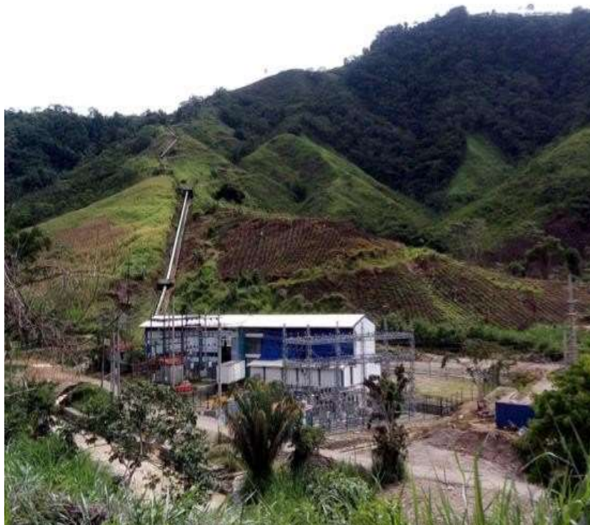
FOTOGRAFÍA 1. Central hidroeléctrica Chalhuamayo.