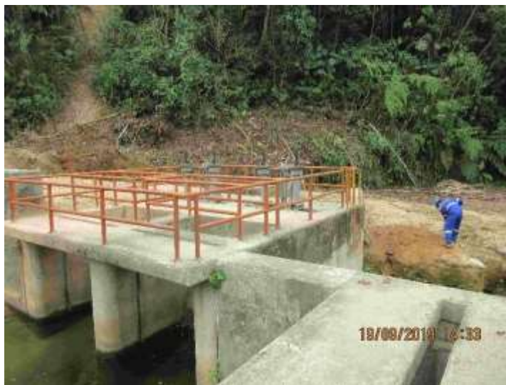
FOTOGRAFÍA 5. Barandas a ser reemplazados y reubicados.