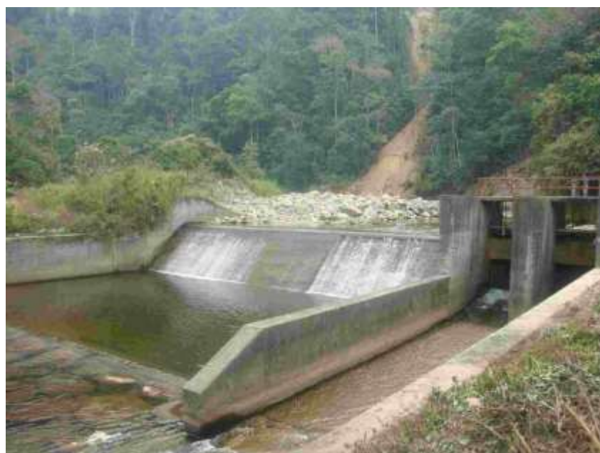
FOTOGRAFÍA 2. Represa Llaylla.