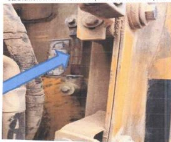
Foto N°13 Se requiere un cambio de aceite debido a que esta por debajo del nivel mínimo.

Foto N°12 Se requiere un mantenimiento para la reprogramación de motor y calibración de todos los componentes de la máquina.