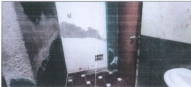
IMAGEN N° 04: ESTADO DE REVOQUES E INSTALACIONES

Por otro lado, se puede apreciar el deterioro del revestimiento y pintura de los muros divisorios de los servicios higiénicos, así como el deterioro en las puertas metálicas, se aprecia oxido y corrosión en la parte inferior.