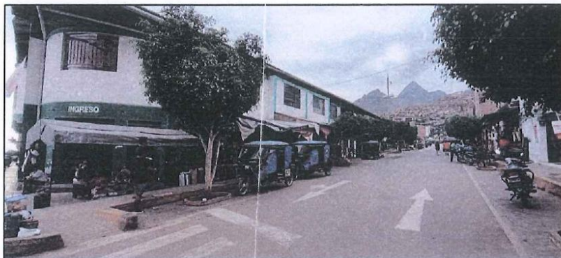
IMAGEN N° 06: FACHADA DE MERCADO EN EL PASAJE COMERCIO