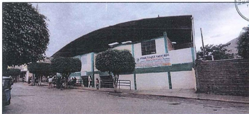
IMAGEN N° 07: FACHADA DE MERCADO EN EL JIRON PIURA

Se puede apreciar la pintura deteriorada en las fachadas del mercado municipal así también como un sistema de drenaje pluvial que se encuentra colapsado y lleno de lodo que imposibilita la salida del agua de lluvia inundando el mercado, a su vez, por la topografía y forma del mercado municipal permite que en las épocas de lluvia el agua baje por el Jirón Piura y el Pasaje Comercio e ingresando por las puertas numero 3 (Jirón Piura) y la puerta numero 1 (Pasaje Comercio), y ante el aumento de