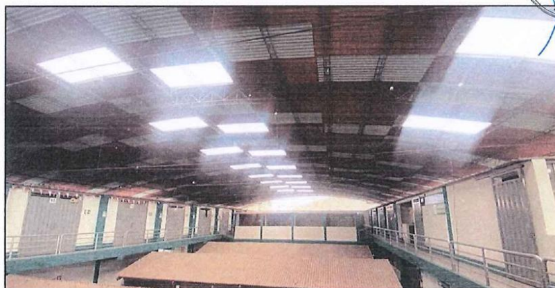
IMAGEN N° 05: VISTA INTERNA DEL MERCADO MUNICIPAL

El techado general de la infraestructura está compuesta por estructuras metálicas que sostienen un techado de polipropileno opaco y con un patrón de techado de polipropileno translúcido con la finalidad de dar paso de luz natural al mercado, la