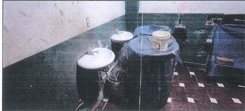
IMAGEN N° 02: SISTEMA DE ALMACENAMIENTO DE AGUA

del día impidiendo el uso de lavaderos cuando se carece de agua, contando que solo cuentan con agua potable entre 1 a 2 horas por días se ven obligados en almacenar agua en barriles de plástico.