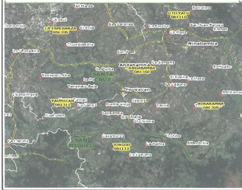
Gráfico N° 02: Micro Localización de la I.E César Vallejo A. Vallejo Mendoza

Distrito Turístico: Las Grutas de Uchayashige, El Troqueño, Pindas Precincas y La Laguna