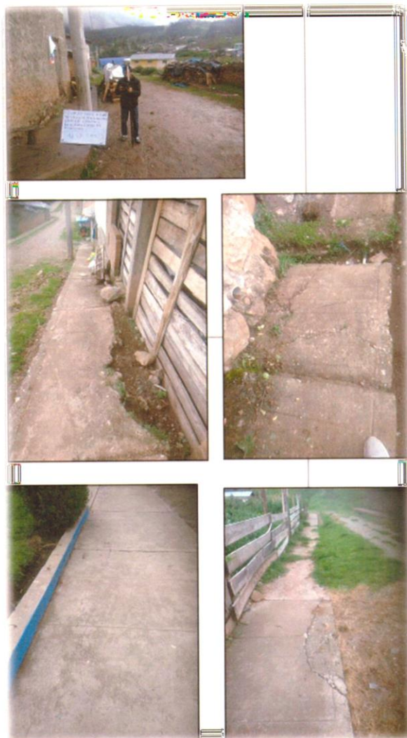
Veredas en mal estado.

Se presenta algunas vistas. Para mayor detalle ir al 2.11.9 plano de demoliciones y 2.11.10 plano de secciones registradas.