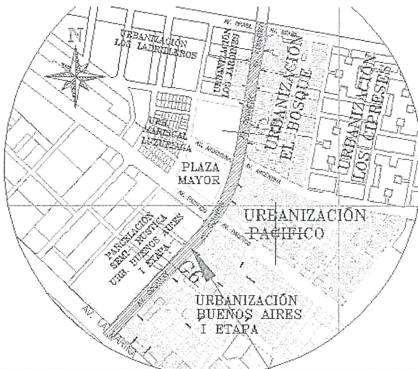
VISTA DEL AREA DE ESTUDIO