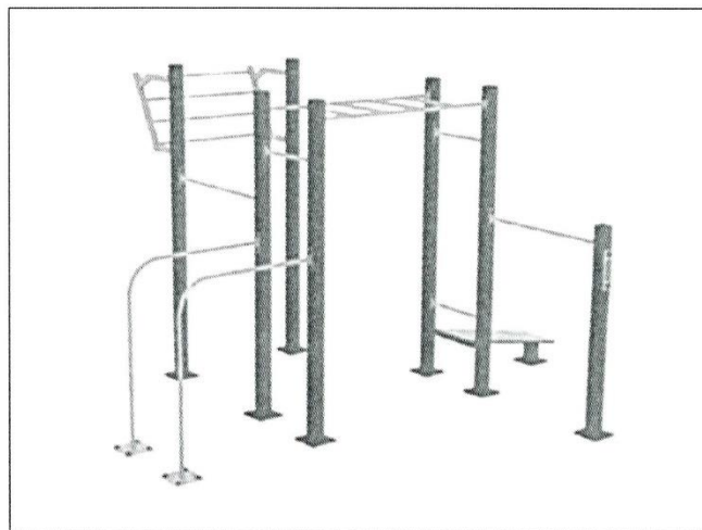
VISTAS 3D (IMAGEN REFERENCIAL)