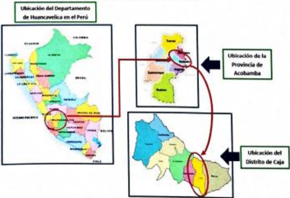
IMAGEN N°02: UBICACIÓN DEL AMBITO DEL PROYECTO