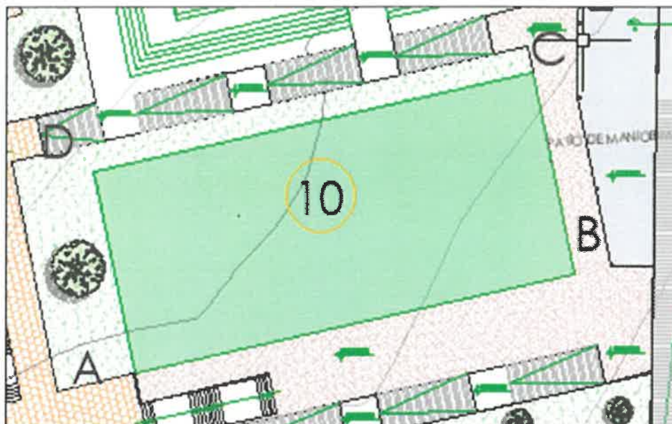
Pabellón del comedor de la Universidad Nacional 'Ciro Alegría'.