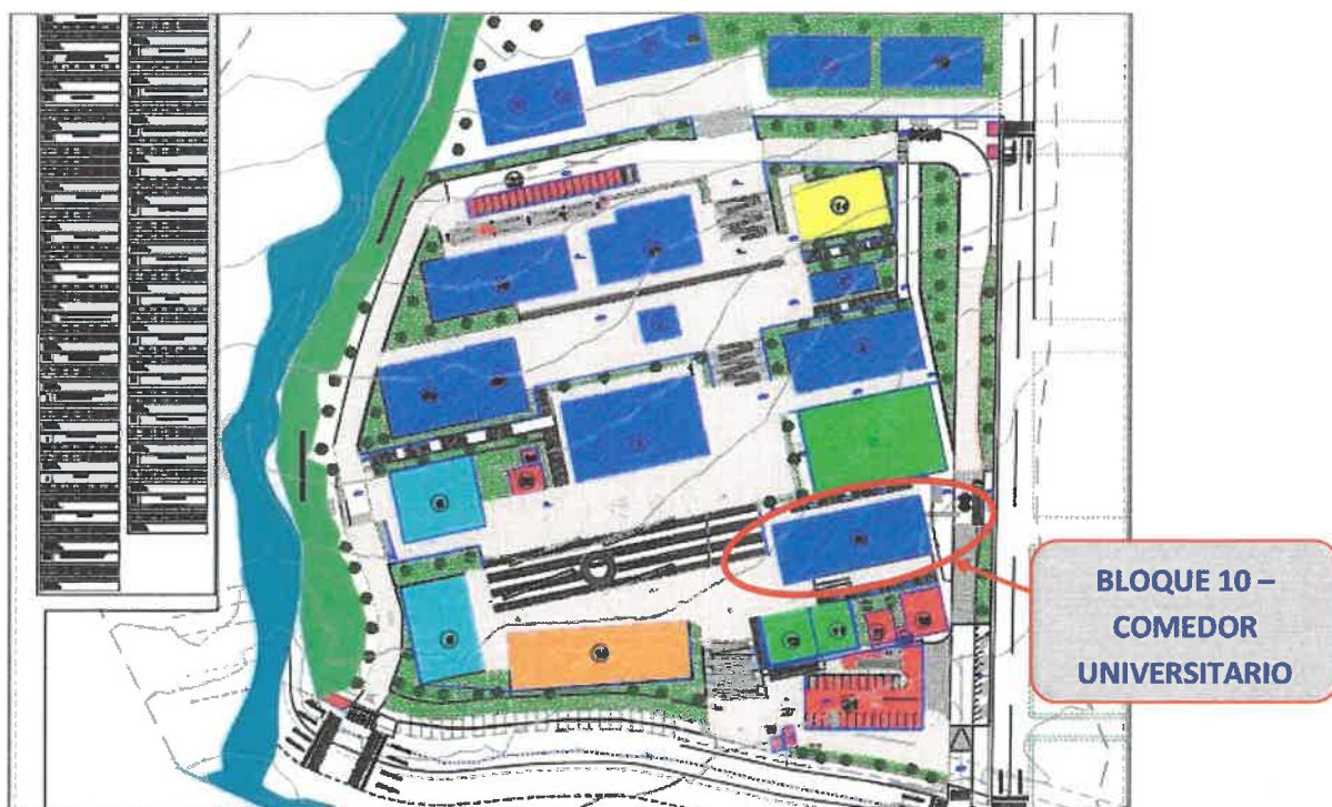
Ubicación de Comedor Universitario

El bloque N° 10 está ubicado sobre casi las 3 primeras hectáreas del terreno total (2.99802511 ha = 29980.2511 m 2 ). Esta se caracteriza por poseer la menor pendiente media longitudinal y transversal del terreno total, la propuesta arquitectónica se desarrolla en el bloque N° 10, como se muestra a continuación: