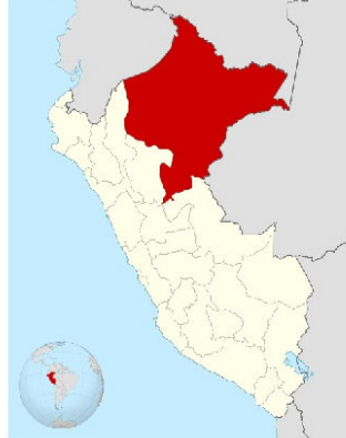
UBICACIÓN DE LA REGION LORETO