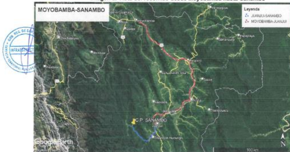
Imagen 2: Vista del recorrido desde Moyobamba hasta Sanambo