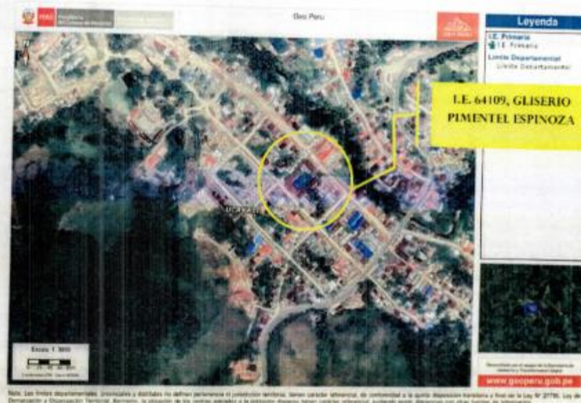
Ilustración 1. Vista Satelital de la Ubicación de la IE en el Distrito de Huipoca