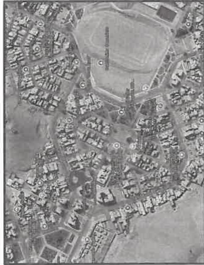
Figura N°1: Ubicación de la I.E. N°105.