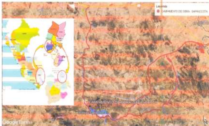
Accesos a la obra - Sapanccota

La prestación del servicio se ejecutará en un plazo de (275) días calendario y/o hasta completar las horas máquinas solicitadas a partir del internamiento de la maquinaria.