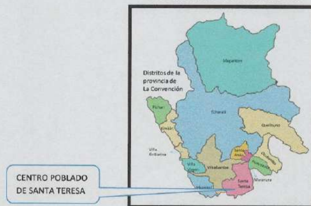
IMAGEN N° 01: LOCALIZACIÓN GEOGRÁFICA PROVINCIA: LA CONVENCION