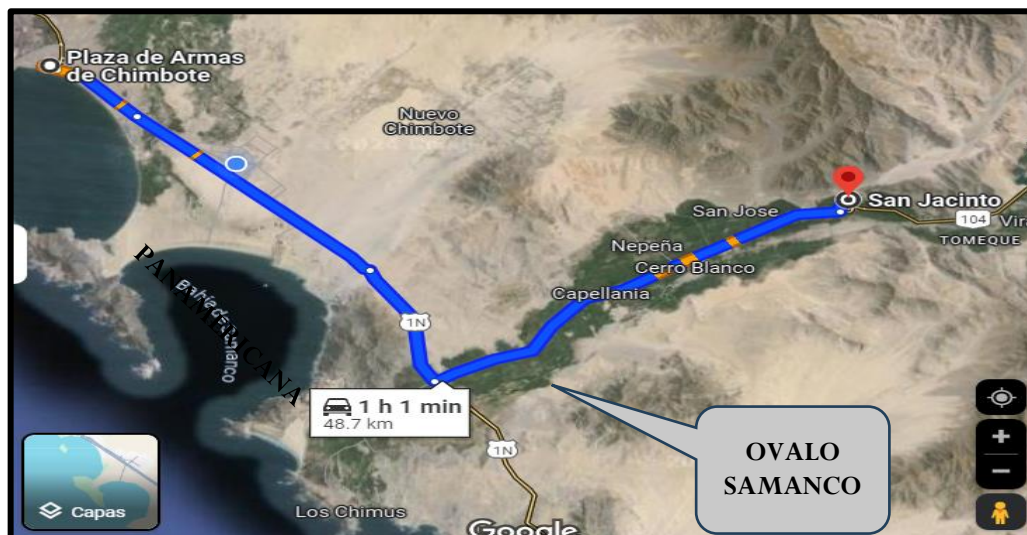
Figura 2. VÍA DE ACCESO AL CENTRO POBLADO SAN JACINTO