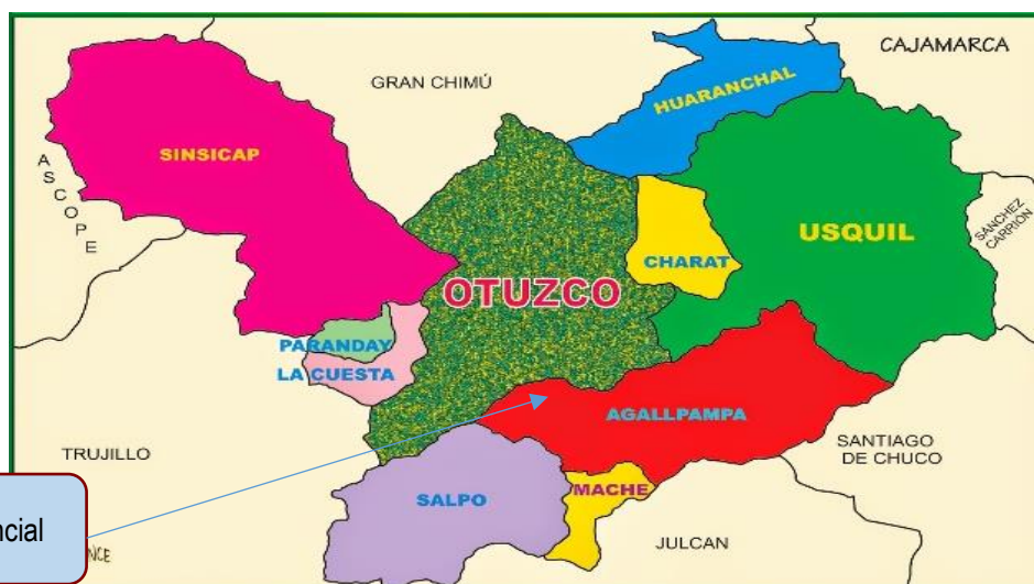
Gráfico N° 03: Micro Localización provincial