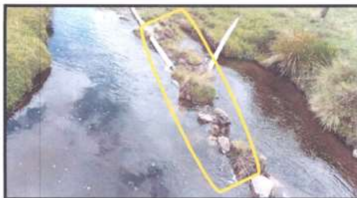
FOTOGRAFÍA N° 10 CONSTRUCCIÓN DE UN TRAMO DE CANAL DE CONDUCCIÓN