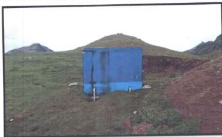
FOTOGRAFÍA N° 11 VISTA PANORÁMICA DEL RESERVORIO DE AGUA DEL ANEXO DE SANGRAR