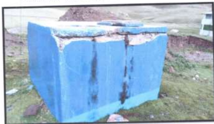
FOTOGRAFÍA N° 14 RESANE CON MORTERO EN RESERVORIO