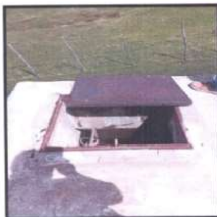
FOTOGRAFIA N° 03 CAMBIAR BISAGRAS Y CANDADO EN TAPA METÁLICA DE CUARTO DE VÁLVULAS.