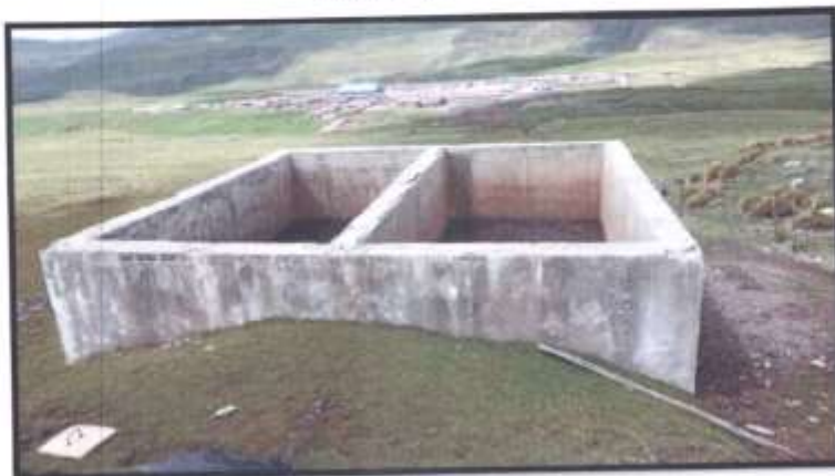
FOTOGRAFIA N° 05 INSTALAR ESCALERA DE GATO Y COLOCAR UN CERRAMIENTO CON MALLA RASHELL 80%