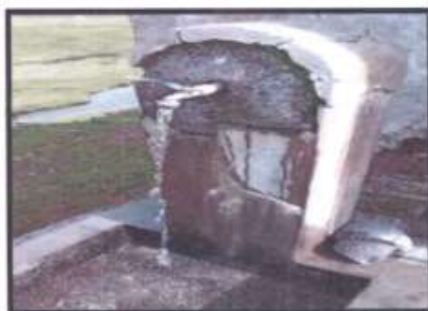
FOTOGRAFÍA N° 15 RESANE CON MORTERO EN PILETA