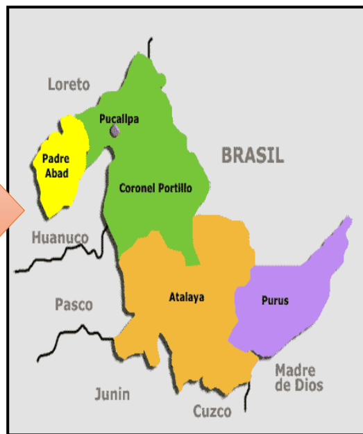
Mapa macro localización del departamento de Ucayali