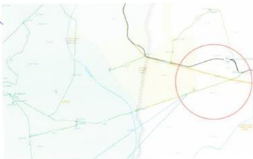
Camino Vecinal, Emp. Cu-902 (Zurite) - Occoruro (Emp. Cu-110)

El contratista debe cumplir los siguientes requisitos: