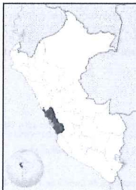
UBICACIÓN GEOGRÁFICA DEL DEPARTAMENTO DE LIMA

Región : Lima Departamento : Lima Provincia : Lima Distrito : Miraflores