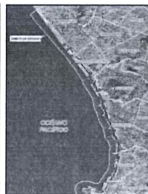
UBICACIÓN GEOGRÁFICA DESDE EL DISTRITO DE SAN MIGUEL HASTA CHORRILLOS

Mixto (Tarifas para la supervisión de la ejecución de la obra y a Suma Aizada para la Liquidación de Contrato de Ejecución de Obra), Artículo 35°, literal c) del RLCE.