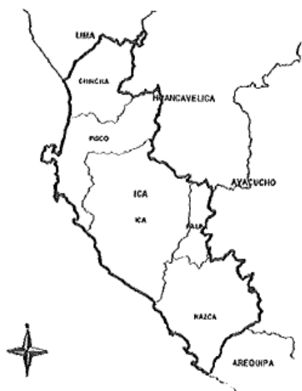
MAPA POLÍTICO DEL DEPARTAMENTO DE ICA