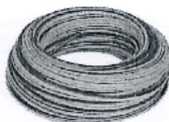
Imagen referencial N°07: Cable tipo CPT N° 14 AWG Línea tierra X 100 m