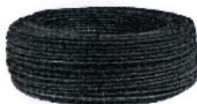
Imagen referencial N°09: Cable de cobre concéntrico tipo SET de 2x4 mm 2