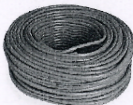
Imagen referencial N°04: Cable Vulcanizado 3 X 18 X 100 m