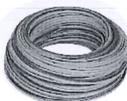
Imagen referencial N°06: CABLE ELÉCTRICO TIPO THW N° 10 AWG X 100 m