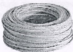
Imagen referencial N°08: Cable unipolar N° 12 AWG X 100 m