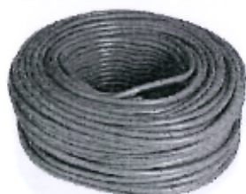
Imagen referencial N°05: Cable Vulcanizado 4 X 18 X 100 m