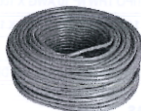
Imagen referencial N°02: Cable Vulcanizado 3 x 16 x 100 m