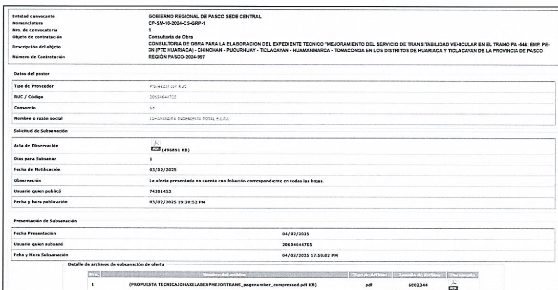
IMAGEN 2

POSTOR: JOHAXANDRA INGENIERIA TOTAL E.I.R.L. , se deja constancia en actas que la oferta presentada por el postor el día 31 de enero de 2025, se encontraba observada, por ello se requirió a través de CARTA N° 003-2025-CP-SM-10-2024-CS-GRP de fecha 03.02.2025 su corrección en un plazo de un (01) día hábil. El cual conforme a la imagen extraída del SEACE fue cumplida en el plazo otorgado: