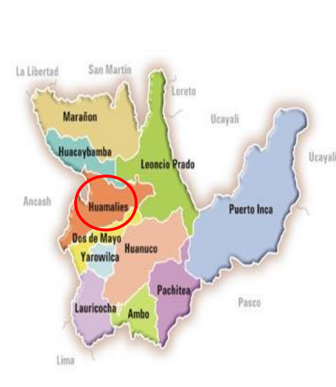
Ubicación en el ámbito provincial