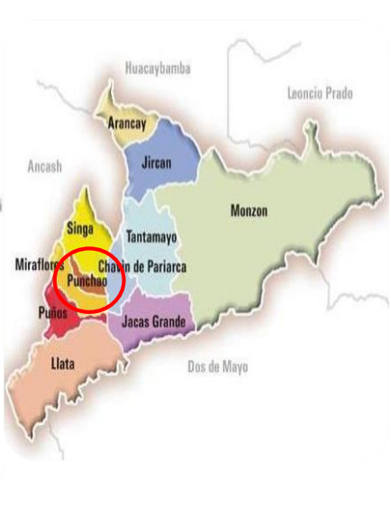
Ubicación en el ámbito distrital

El Valor referencial de la consultoría de obra asciende al Monto de S/. 106,913.90 (CIENTO SEIS MIL NOVECIENTOS TRECE MIL CON 90/100 SOLES INC. IGV.) , calculados a marzo de 2024, el cual incluye todos los Impuestos de Ley.