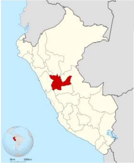
Ubicación en el ámbito departamental