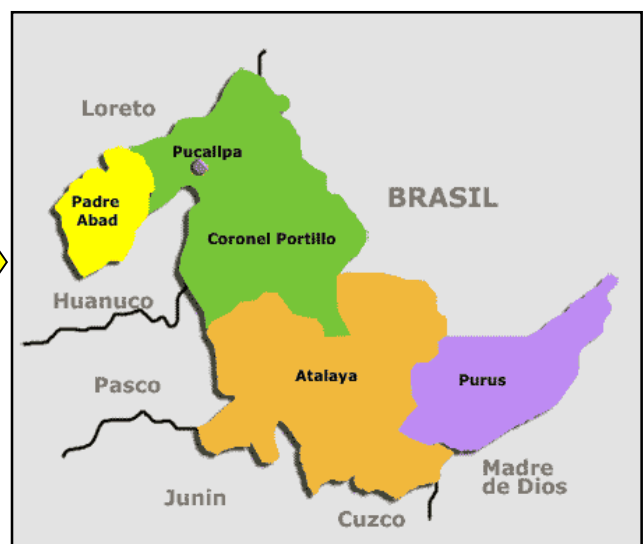
Mapa macro localización del departamento de Ucayali