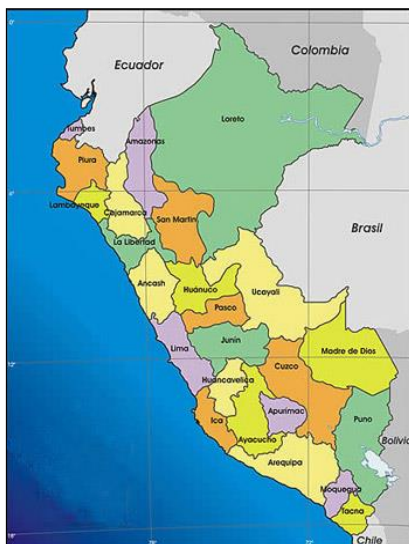
Mapa de macro localización del Perú

Los beneficiarios con la ejecución del Proyecto, se encuentran ubicados en el Distrito de Callería, Provincia de Coronel Portillo, Departamento de Ucayali, Ciudad de Pucallpa, específicamente en Av. 09 de Octubre (Av. Huayna Cápac ∩ Jr. Cápac Yupanqui), Geográficamente la ciudad de Pucallpa se encuentra ubicada entre las coordenadas: 08°23'04" de latitud sur; y, 74°31'57" de longitud oeste, una altitud de 154 m.s.n.m. La zona a intervenir, está ubicada en la parte sur este de la ciudad de Pucallpa, perteneciendo a la zona urbana periférica de la ciudad.