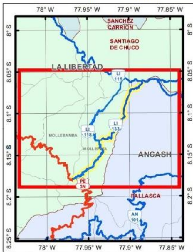
MAPA DE UBICACIÓN DE LA CARRETERA DEPARTAMENTAL LI-121

"Año del Bicentenario, de la consolidación de nuestra independencia, y de la conmemoración de las heroicas batallas de Junín y Ayacucho"