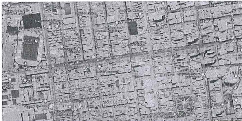
Figura 1: Ubicación de la Av. Isabel La Católica iniciando por el Jr. Abtao hasta el Jr. Huánuco, en el distrito de La Victoria

Ubicación Política Región : Lima Departamento : Lima Provincia : Lima Distrito : La Victoria Localidad : La Victoria