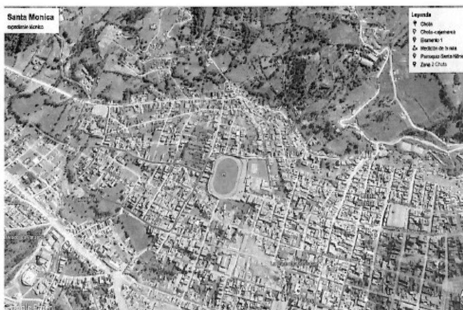
Imagen 2: Ubicación del Proyecto en la Ciudad de Chota