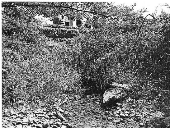
En esta toma se puede apreciar la colmatación y el mal estado en que se encuentra la alcantarilla.

La Alcantarilla de conducción del Canal Compuertas Negras que en su progresiva 0+000 (toma de captación) que conduce el agua por debajo del camino de servicio del Canal Miguel Checa, se encuentra en mal estado y colmatado de vegetación.