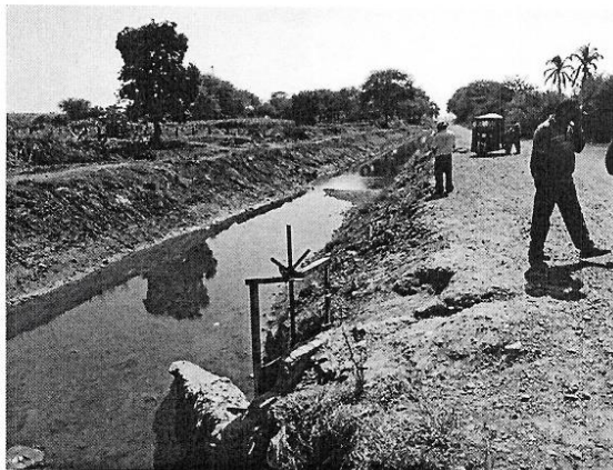
En esta toma se puede apreciar el mal estado de la toma de captación del Canal Compuertas Negras.

La Alcantarilla de conducción del Canal Compuertas Negras que en su progresiva 0+000 (toma de captación) que conduce el agua por debajo del camino de servicio del Canal Miguel Checa, se encuentra en mal estado y colmatado de vegetación.