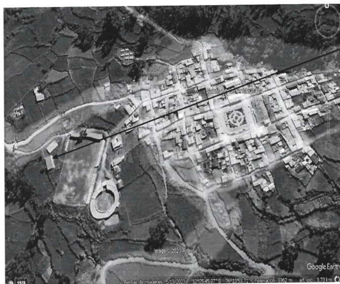
PUESTO DE SALUD ANCHUCAYA