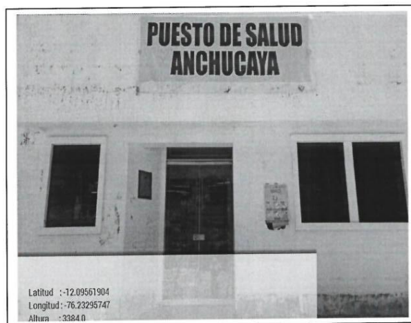
Fotografía de la fachada del Establecimiento de Salud