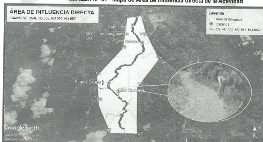
IMAGEN N° 01 - Mapa de Área de Influencia directa de la Actividad