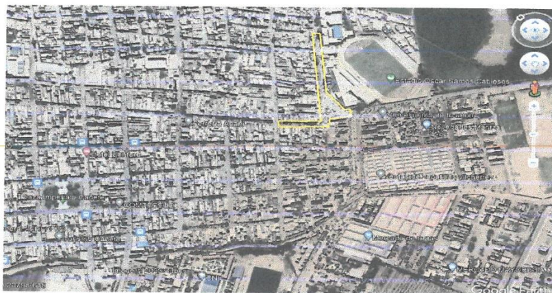
Imagen satelital / Google Earth.

Imagen N° 1: Tramos proyectados e identificación de zonas en intervención.