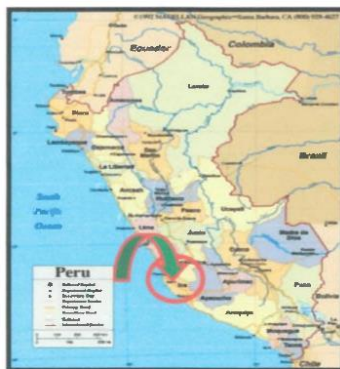
Ilustración 1: Mapa Político del Departamento de Ica