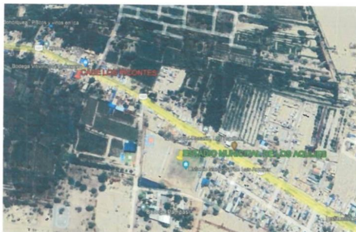
Ilustración 2: Ubicación del proyecto

Creada por Ley N° 5566-29 de noviembre de 1926