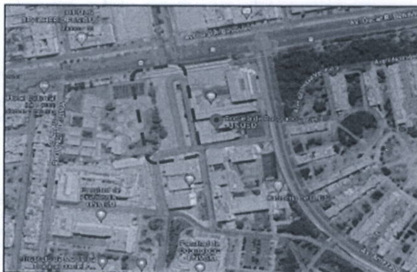
Ilustración 1: Vista Satelital del Terreno a intervenir

El proyecto se localiza en zona de expansión, El predio corresponde a un terreno de forma regular, de topografía ligeramente plana, con acceso a la ciudad universitaria por la puerta N° 7 y 8.