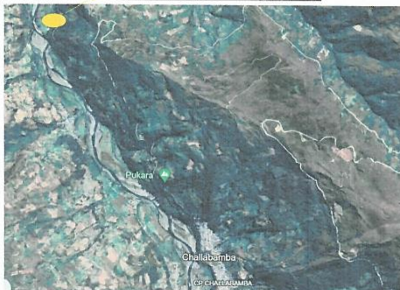
Imagen: Ubicación de la Obra.