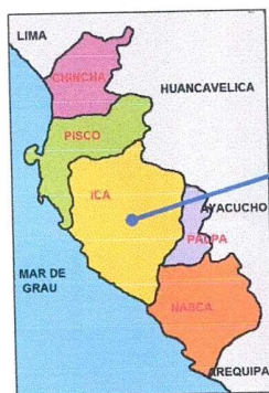
Mapa del Departamento de Ica

Para acceder desde la Plaza de Armas del distrito de San Juan Bautista, se tiene que tomar el camino asfaltado hacia el C.P. Quilloay, cuya distancia es de aproximadamente 2.50Km., a la zona donde se realizara el presente proyecto.