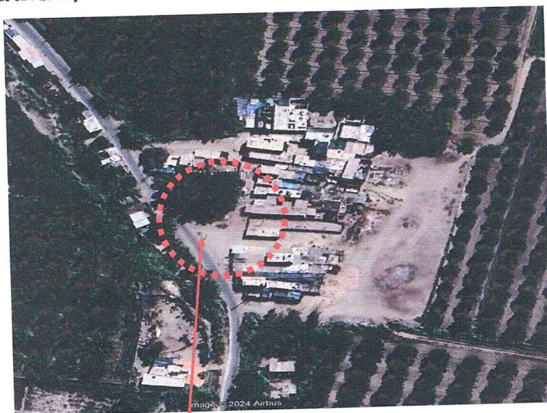
UBICACIÓN DEL PROYECTO