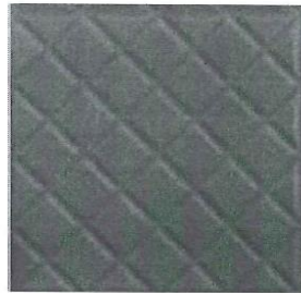
Imagen 2 Adoquín de Concreto (0.30x0.30x0.04m)