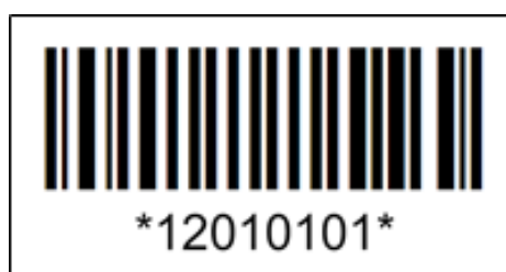
Imagen 1. Modelo impreso de código de barras.

En el proceso de adición de data variable a los instrumentos que la requieran, se debe tener en cuenta el formato de impresión del código de barras 12 . En ese sentido, los códigos de barra se imprimen acompañados de la numeración correspondiente, entre asteriscos, conforme a la siguiente imagen: