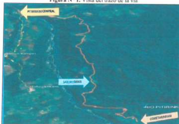
Figura N° 1. Vista del trazo de la vía