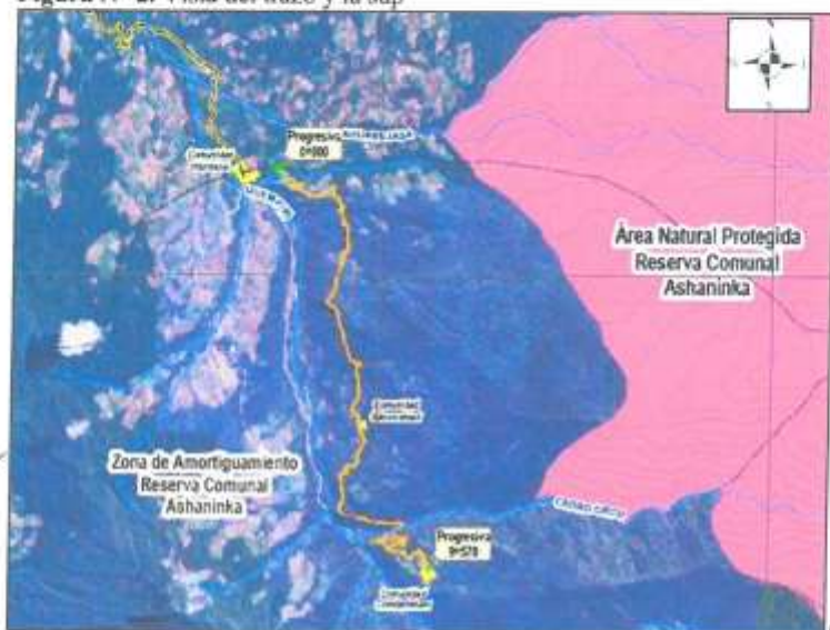
Figura N° 2. Vista del trazo y la sup

De la revisión de la información gráfica de las áreas naturales protegidas, el proyecto "Creación del camino vecinal entre las comunidades de Pitirinkini Central, Saboroshiari y Comitarinkani del distrito de Unión Asháninka - Provincia de La Convención - departamento de Cusco" se encuentra en la zona de Amortiguamiento de la reserva comunal Unión Asháninka , a continuación, se detalla en la siguiente imagen: