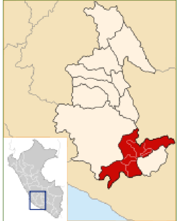
Ilustración 02: Ubicación de la provincia de Parinacochas